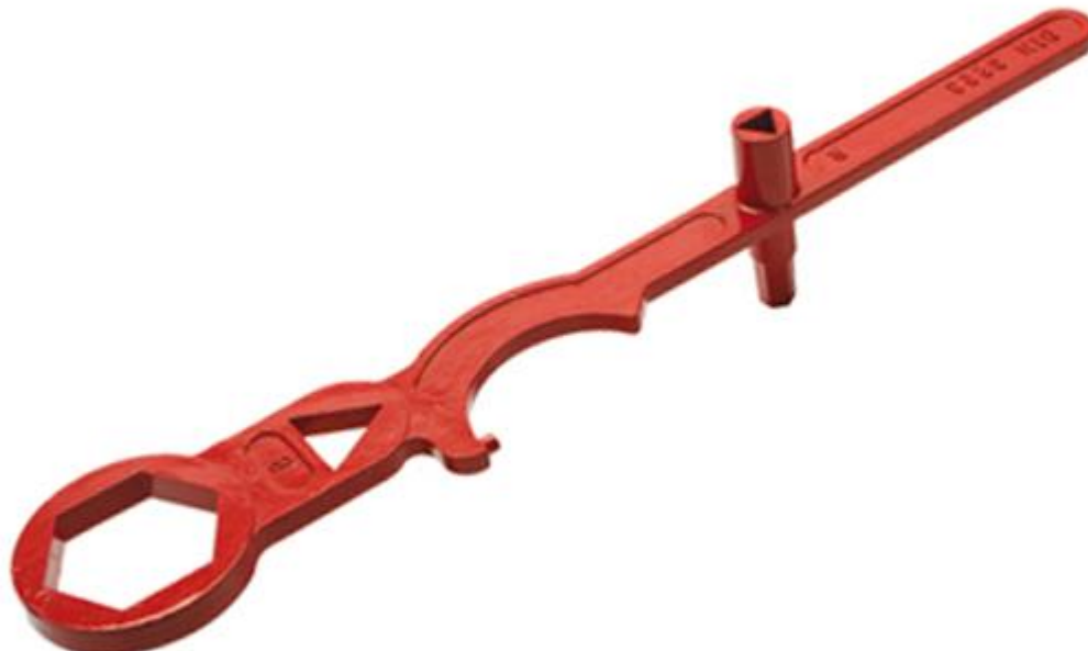
Abbildung 3 - Hydrantenschlüssel

Nur sorgfältige Befolgung dieser Hinweise stellt die Verwendungsbereitschaft der Hydranten für Entnahmewecke sicher und verhindert Schadensersatzansprüche z.B. in Brandfällen.